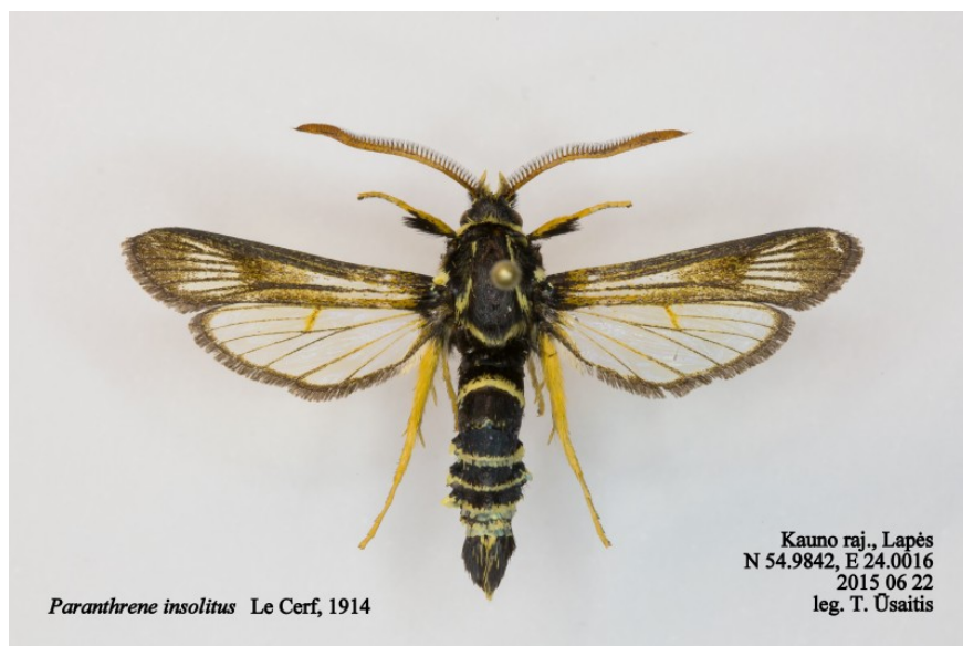
Fig. 1. Paranthrene insolitus