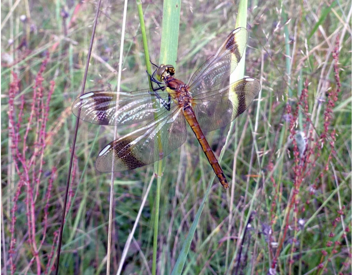
Sympetrum pedemontanum patelė, Spenglos upės slėnis, 2022-08 -02