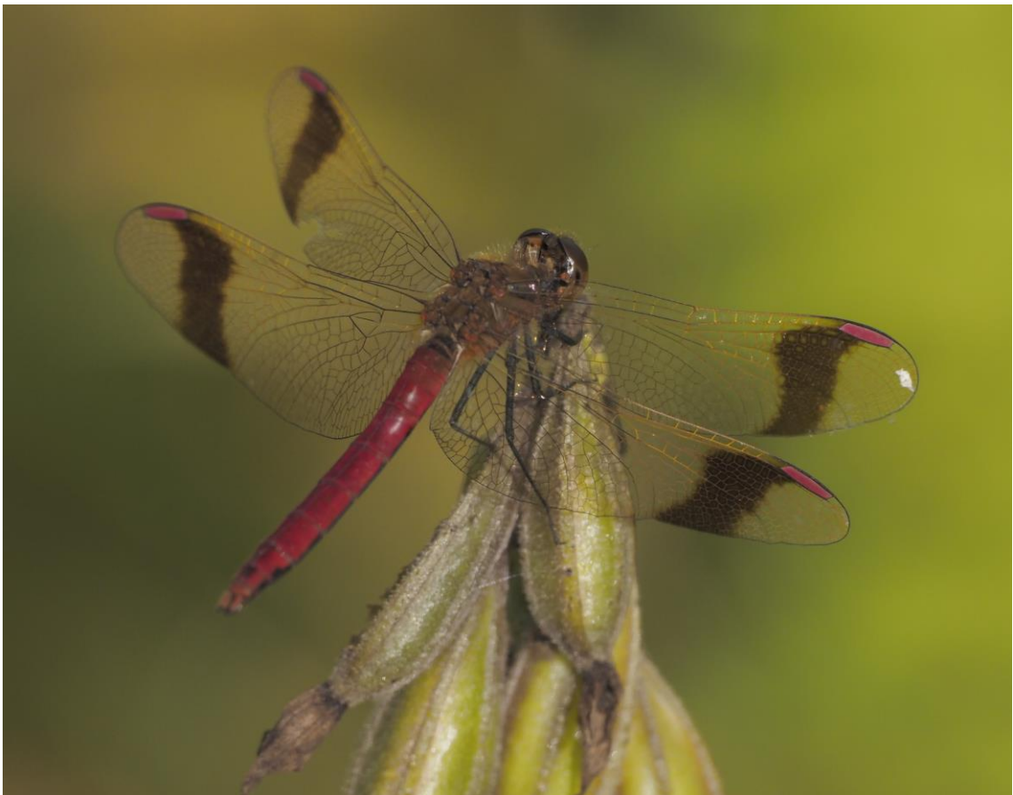
Sympetrum pedemontanum patinas, Lakajos upės slėnis, 2020-08 -13